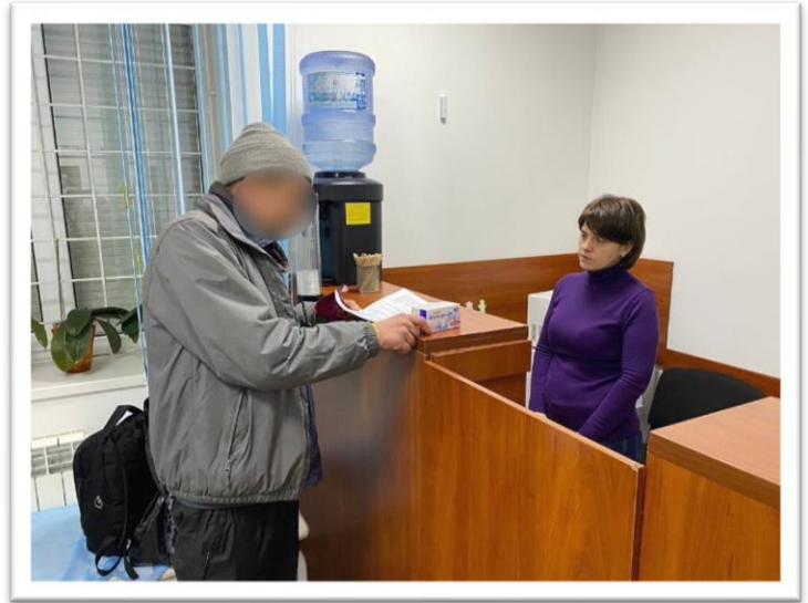
Видача препарату ЗПТ, Харків