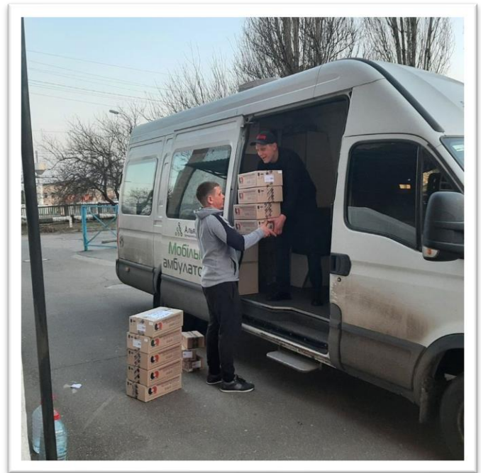
Доставка препарату на сайти Черкаської області