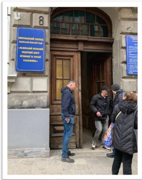
Пацієнти ЗПТ-переселенці біля сайту ЗПТ у Львові