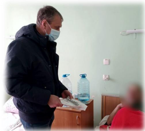
Доставка препаратів АРТ, Дніпропетровська область