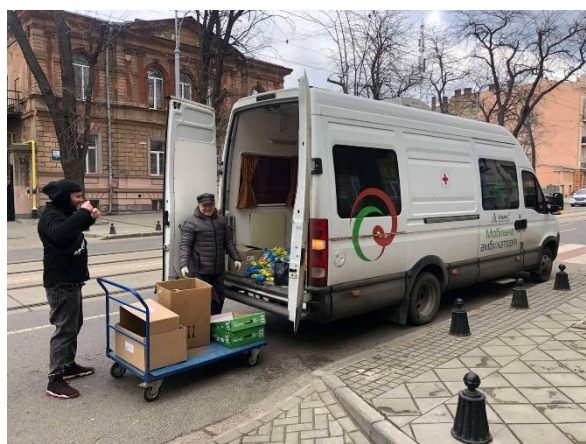
Гуманітарний вантаж в Одесі

Також робота багатьох партнерських організацій переформатована на надання гуманітарної допомоги . За погодженням з Альянсом, для розвезення гуманітарних вантажів використовуються мобільні амбулаторії, також завдяки перерозподілу коштів закупляються гуманітарні вантажі. Партнерська організація «Соціальні ініціативи з охорони праці та здоров'я», завдяки оперативному реагуванню Альянсу та зміні цільового призначення наявних коштів і спрямування їх на гуманітарну підтримку, зібрала нагальні потреби у забезпеченні гуманітарних потреб та організує закупівлі та відвантаження необхідної продукції. Допомога орієнтована на клієнтів соціальних служб, що звертаються за допомогою і мають дітей. Цінні гуманітарні вантажі вже доставлені у Київ, Рубіжне, Северодонецьк, Слов'янськ, Кременну, Добропілля, Херсонську область. Вони містять продукти, ліки, дитячі підгузки.