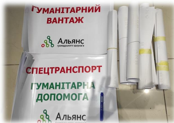
Тепер наші буси матимуть спеціальні наклейки