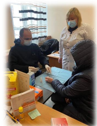
Фото: Тестування у БО "Синергія душ" (Дніпро), березень 2022

Діяльність вар'юється в залежності від регіону – в містах, які знаходять у зоні інтенсивних військових дій, робота проекту припинена. Так, у Чернігові офіс не працює, у Миколаївській області тестування практично не проводиться, лікарі працюють з пораненими у лікарнях, хоча у більш спокійних регіонах (Южноукраїнськ, Братське, Новий Буг) робота поки проводиться у штатному режимі, як і у Дніпрі, Запоріжжі, Одесі, Полтаві та Кропивницькому . Реальності воєнного стану вносять свої