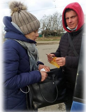
Фото: видача препаратів АРТ пацієнту, Одеса