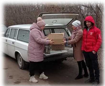
Фото: Робота в польових умовах. ГО "Життя +", Одеса

В рамках напрямку « Активне виявлення випадків туберкульозу серед людей, які опинились у складних життєвих умовах та є отримувачами соціальних послуг у соціальних службах/закладах » зібрані нагальні потреби у забезпеченні гуманітарних потреб клієнтів проекту та організуються закупівлі необхідної продукції. Допомога направлена зорієнтована на клієнтів соціальних служб, що звертаються за допомогою і мають дітей.